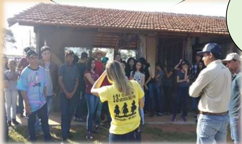
Visita da escola Antônio Henrique