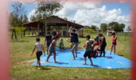
Brincadeira livre, simbólica e jogos