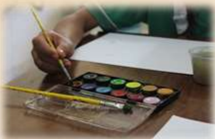
Acolhida – Propostas Permanentes