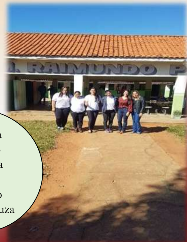
Equipe da Fundação visitando a escola Raimundo Pedro de Souza