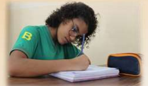
Tarefa de casa, Projetos e Oficinas