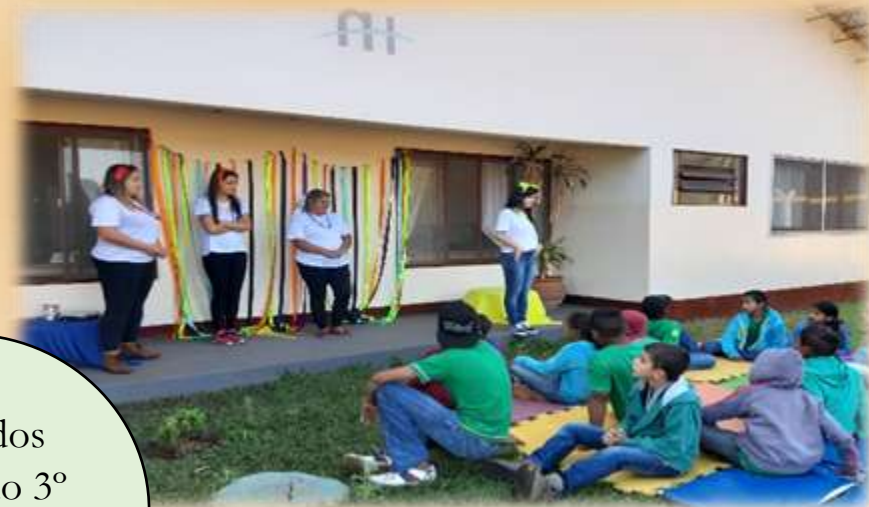
Visita dos alunos do 3º ano da escola Paulo Simões

A presença de outras entidades demonstra a significativa contribuição da Fundação AH para a região de Brasília. As visitas realizadas pela equipe da Fundação AH para outros locais, permite a troca e o diálogo com diferentes realidades.